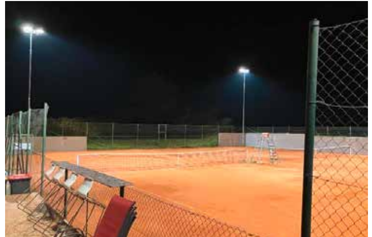
Die neue Flutlichtanlage am Tennisplatz Schollach.